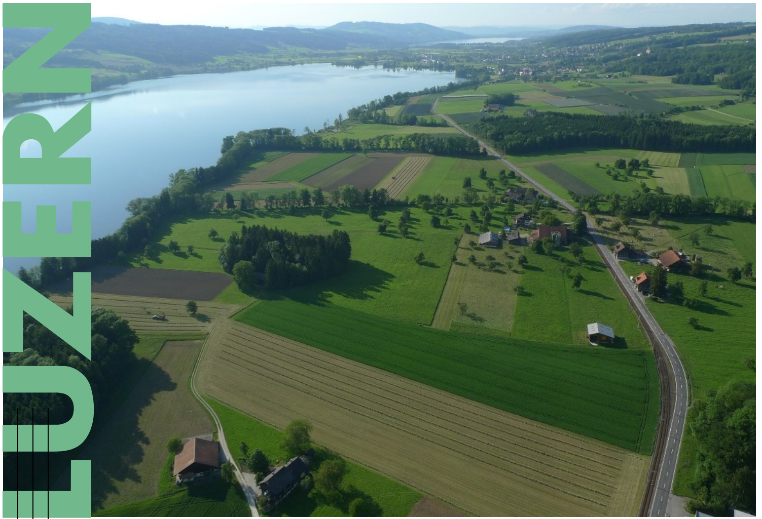
Landwirtschaft am Baldeggersee