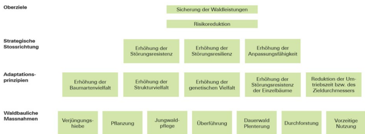
Abbildung 5: Schema der Anpassung an den Klimawandel mit den 5 Adaptationsprinzipien (Brang, Küchli, Schwitter, Bugmann und Ammann, 2016).

Oberstes Ziel der Anpassung des Waldes an den Klimawandel ist die Erhaltung der Waldleistungen und die Reduktion von Risiken. Als Adaptation wird die bewusste Anpassung der Wälder an das sich verändernde Klima verstanden. Die Wälder sollen möglichst resistent (widerstandsfähig), resilient (Fähigkeit, sich zu regenerieren) sowie anpassungsfähig sein. Soweit möglich werden für die Adaptation natürliche Prozesse wie Naturverjüngung und Selbstdifferenzierung genutzt; dadurch hat die Anpassung tiefere Kosten und geringere Risiken. Gleichzeitig wird die Anpassung des Waldes an den Klimawandel durch gezielte, bewusste waldbauliche Massnahmen vorangebracht. Die Überlegungen der Adaptation sind in Abbildung 5 zusammengefasst.