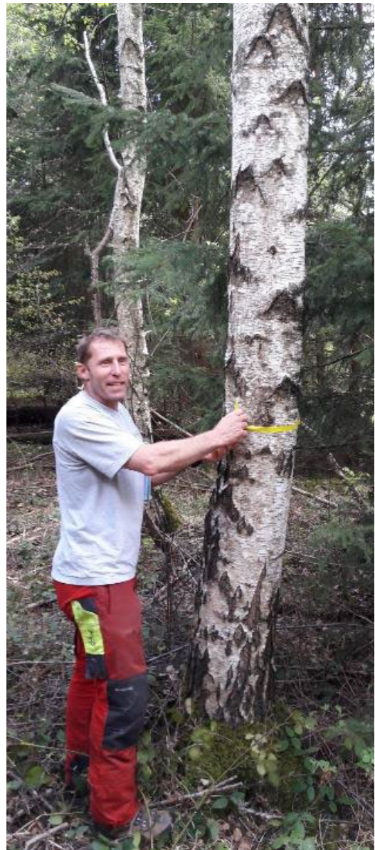
Abbildung 11: Waldbau mit Birke ist heute nicht mehr aussergewöhnlich.

Der Klimawandel verläuft so ausserordentlich rasch, dass die langlebigen Bäume teilweise überfordert sind. Es kommt vermehrt zu Zwangsnutzungen, auch bereits bei jungen Beständen. Schnelles Wachstum und kurze Umtriebszeiten sind deshalb ein Vorteil. Besonders schnellwachsend sind Pionierbaumarten wie Birke, Aspe, Schwarzerle oder Salweide. Bei genügend Licht sind sie nach wenigen Jahren den Hauptbaumarten um das Zwei- bis Dreifache im Höhen- und Durchmesserwachstum voraus. Dadurch werden rasch wieder Waldleistungen erbracht, sei es für die Holzproduktion und CO 2 -Bindung, im Schutzwald, für die Erholung oder für die Biodiversität. Birke wächst ohne Pflanzung oder Pflege und bildet gerade, astfreie Stämme mit vielfältig nutzbarem Holz (Abb. 11). Auch Aspe oder Schwarzerle produzieren gerade Stämme, allerdings mit etwas weicherem Holz.