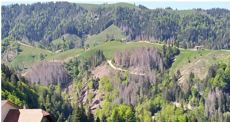
Abbildung 2: Waldschäden 2018-2020 im Gebiet Napf-Süd auf flachgründigen Böden als Folge der Trockenheit im Jahr 2018.

Die stärkere Verdunstung aufgrund der Klimaerwärmung hat eine schnellere Austrocknung der Böden zur Folge. Besonders stark sind die Auswirkungen des Klimawandels in den tiefsten Lagen und an Südhängen. Die Baumarten sind unterschiedlich anfällig auf Trockenheit. Alte und grosse Bäume sind tendenziell anfälliger als junge, kleine Bäume. Zudem spielt der Aufbau des Waldbodens eine wichtige Rolle: Tiefgründige Böden haben eine höhere Wasserspeicherfähigkeit als flachgründige (Abb. 2) oder kiesige Böden.