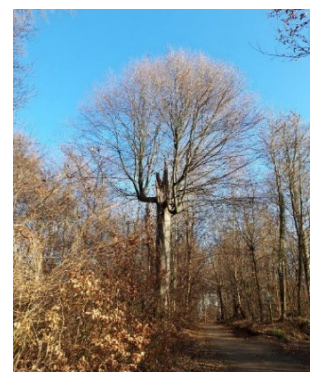
Abbildung 6: Ein Habitatbaum als Beispiel für Strukturvielfalt.

Strukturvielfalt hilft, Wälder resistenter und anpassungsfähiger zu machen. Dazu gehören Überhälter, Habitatbäume (Abb. 6), Pionierbaumarten, Sträucher und Totholz. Konkrete Beispiele für die positive Wirkung dieser «Elemente des naturnahen Waldbaus» sind: Samenproduktion, Beschattung, Speicherung von Wasser. Mit «Struktur» sind somit nicht nur stufige Bestände gemeint, sondern alle Elemente, welche die Homogenität von Wäldern verringern.