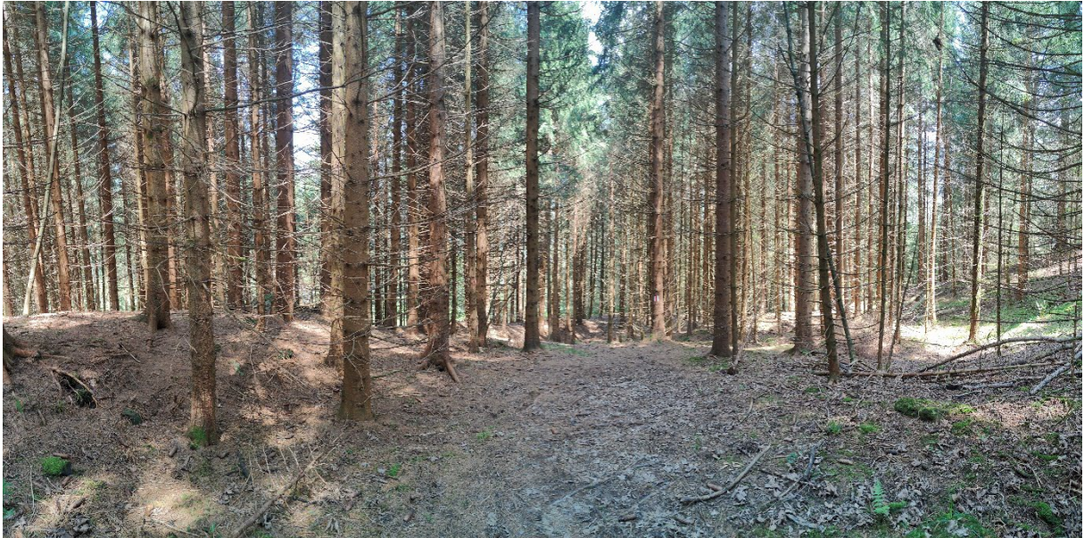
Abbildung 15: Nochmals durchforsten oder vorzeitig verjüngen? Der noch dunkle Boden ohne Konkurrenzvegetation bietet Chancen für die vorzeitige Verjüngung mit zukunftsfähigen Baumarten. (siehe auch Fotosphären Chaserewald, Altbüron )