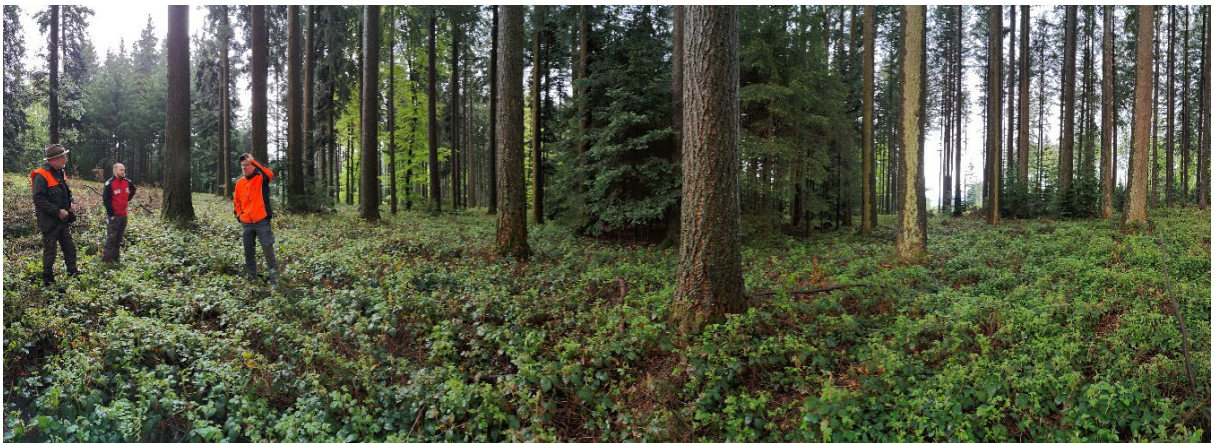
Abbildung 14: Mischbestand mit Douglasien in Triengen. Beispiel für eine nicht-invasive Zukunftsbaumart.

Durch den Klimawandel sind wichtige Wirtschaftsbaumarten unter Druck. Krankheiten wie Eschenwelke oder Ulmensterben schränken die Baumartenpalette zusätzlich ein. Nebst den einheimischen Zukunftsbaumarten bieten Gastbaumarten Möglichkeiten zur Erweiterung der Baumartenpalette. Um Fehlinvestitionen zu vermeiden, ist die Kenntnis der Standortansprüche sehr wichtig. Gastbaumarten sind mehr oder weniger neu im Ökosystem und deshalb erhöhten Risiken durch Schädlinge ausgesetzt. Beispielsweise hatte die Grosse Küstentanne während ca. 40 Jahren ein gutes Wachstum, jetzt beginnt sie verbreitet auszufallen. Gastbaumarten sollen nie als Reinbestände, sondern immer in Kombination mit einheimischen Baumarten (Abb. 14), wenn möglich aus Naturverjüngung, eingebracht werden. Beim Einbringen von Gastbaumarten sind die Einschränkungen gemäss «Verordnung über forstliches Vermehrungsgut» sowie gemäss «Instruktion Jungwaldpflege Kanton Luzern» zu beachten.