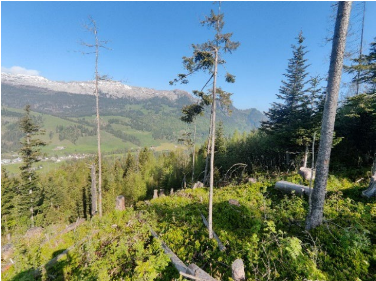
Abbildung 4: Grosse Schadenfläche in Flüeli/Sörenberg.

Wenn aufgrund des Klimawandels in Zukunft ganze Wälder oder Bestände absterben (Abb. 4), können Waldleistungen nicht mehr vollumfänglich erbracht werden. Dies ist besonders anschaulich beim Schutzwald. Es gilt genauso für den Erholungswald und die Biodiversitätsleistungen, welche ebenfalls auf genügend alte und dicke Bäume angewiesen sind. Aber auch bei der Holzproduktion soll ein intakter Wald eine kontinuierliche Versorgung sicherstellen. Absterbende Wälder führen zu einem Überangebot an Holz und zu Preiseinbrüchen. In späteren Jahren oder Jahrzehnten wird dieses Holz fehlen.