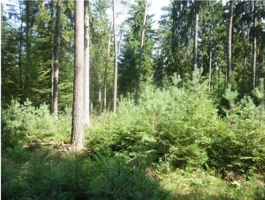
Abbildung 10: Naturverjüngung der Zukunftsbaumart Föhre: Möglich auf geeigneten Standorten dank bewusstem Wechsel von dunkel (Nebenbestand) zu hell (nicht zu kleine Lücken).

Bei dunklen Bedingungen ist der Waldboden frei von Brombeeren und anderen Konkurrenzpflanzen. Zum richtigen Zeitpunkt kann die Verjüngung gezielt mit Licht von oben (Schirmhieb) oder von der Seite (Femel-, Saumhieb) eingeleitet werden. So können sich grundsätzlich alle Baumarten ansamen. Wenn genügend rasch «nachgelichtet» wird, genügt das Licht auch für lichtbedürftige Zukunftsbaumarten (Abb. 10). Wenn aber bereits Brombeeren als Folge von diffusen Auflichtungen vorhanden sind, ist die Ausgangslage erschwert. Durch zu hohe Nadelholzanteile mit oberflächlicher Streuauflage und Versauerung wird die Herausforderung verschärft. Oft sind dann Pflanzungen und intensive Pflegemaßnahmen die teure Alternative.