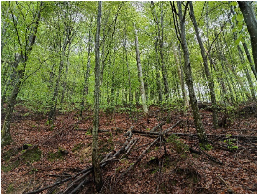
Abbildung 9: Auf dieser ehemaligen Sturmfläche in Wikon, verursacht durch den Orkan Lothar (1999), hat sich aus der Vorverjüngung ein reiner Buchenwald entwickelt – auf diesem trockenen Standort (7d) ein Risikobestand.

Vorhandene Vorverjüngung ist meist ein Garant für gelingende Naturverjüngung. Ohne Vorverjüngung kann es zu einer starken Verunkrautung kommen. Die Vorverjüngung hat jedoch auch Nachteile: Vielfach bleiben nach mehreren Jahren bis Jahrzehnten unter Schirm nur noch Schattenbaumarten übrig. Dadurch wird wieder eine Generation Fichte, Tanne oder Buche verjüngt (Abb. 9). So entstehen auf den entsprechenden Standorten erneut Risikobestände. Zudem steigt die Gefahr von Holzereischäden, je weiter sich die Verjüngung entwickelt.