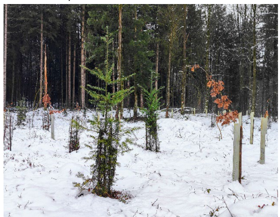
Abbildung 13: Einzelmischung Eiche-Douglasie, welche zu einem Zielkonflikt führt.

Pflanzung ist im Sinne von Ergänzung zu verstehen, d.h. immer zusammen mit Naturverjüngung einheimischer, standortgerechter Baumarten. Pflanzungen werden nur dann vorgenommen, wenn die Zielbaumart mit bewusster Naturverjüngung nicht möglich ist. Gepflanzt werden ausschliesslich Baumarten mit «adaptivem Mehrwert», welche an diesem Standort nicht von allein ansamen würden. Oft wird das Potenzial einer Naturverjüngung unterschätzt, was später zum Scheitern von Pflanzungen oder zu hohen Pflegekosten führt. Flächige, homogenisierende Pflanzungen sind nicht zielführend. Bei der Planung sind folgende Optionen zu prüfen: Räumlich frei verteilte Ergänzungspflanzungen, Trupps, Weitabstand oder Reihenverband (z.B. 12 x 3 m). Die Verwendung von Wildlingen ist eine gute Option.