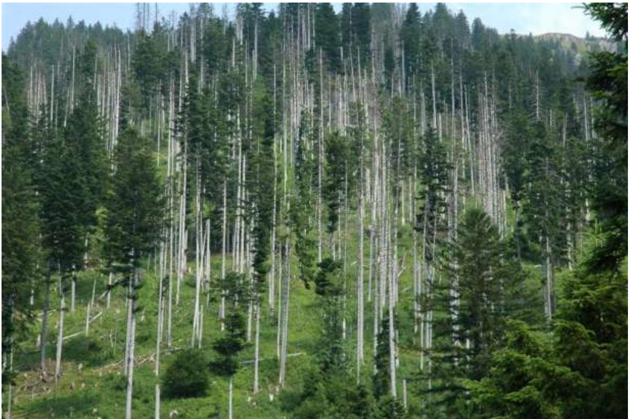
Füfischilt, Escholzmatt (Brächt Wasser 2010)

Verfasserin Dienststelle Landwirtschaft und Wald (lawa) Fachbereich Schutzwald Schüpheim im Februar 2019