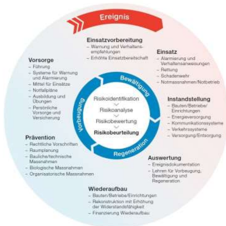
Abbildung. 2: Modell Integriertes Risikomanagement.