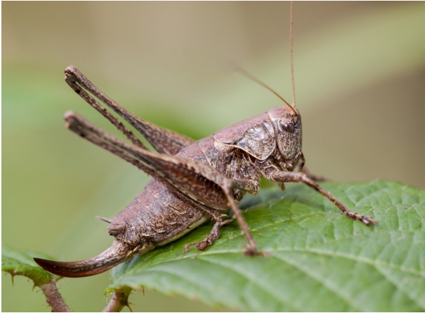
Weibchen / Bild: Florin Rutschmann