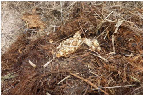
Abbildung 2 Material eines genutzten Eiablagehaufens. In der Mitte ein altes Gelege.

Achtung: Keine Neophyten wie Goldrute oder Springkraut verwenden. Dieses Pflanzgut im Kehricht entsorgen.