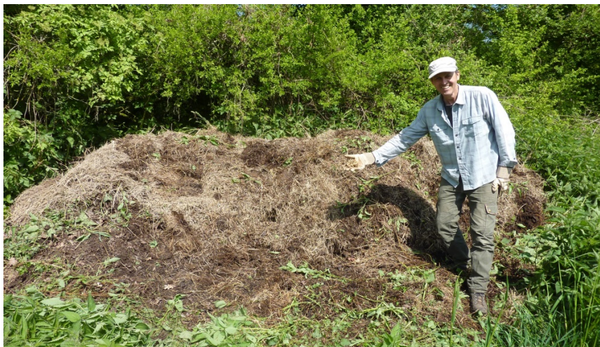
Abbildung 1: In diesem Haufen wurde ein Gelege gefunden. Der Haufen ist ca. 4 m 3 gross, gut besonnt und in eine strukturreiche Umgebung eingebettet.

Achtung: Der Haufen fällt im ersten Jahr um rund 1/3 zusammen. Daher den Haufen vor allem in die Höhe anlegen.