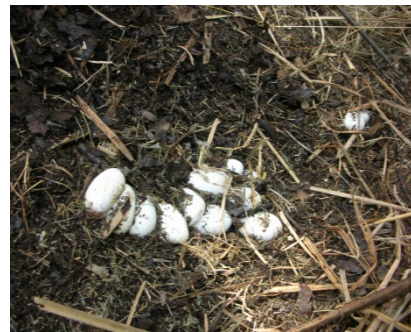
Abbildung 3 Material eines genutzten Eiablagehaufens. In der Mitte ein frisches Gelege.