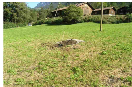
Engerlingsschaden in Wiese

Schäden in Wiesen und Weiden können viele Ursachen haben, der Engerling ist eine davon. Wenn zwischen Ende April bis Anfangs Juni eine Vielzahl von Maikäfer gesehen wurden, sollte im September eine Probegrabung in geschädigten Stellen durchgeführt werden. Dadurch ist zu sehen, ob Engerlinge für den Schaden verantwortlich sind. Ebenfalls kann eine solche Probegrabung im Mai bis Oktober gemacht werden. Denn in dieser Zeit sind die Engerlinge zum Fressen dicht unter der Grasnarbe.