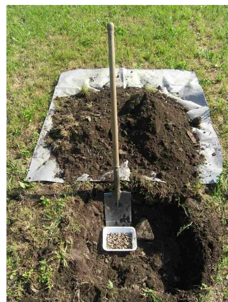
Probegrabung in geschädigter Stelle.

Anschliessend wird die Zahl der gefundenen Engerlinge Mal 4 gerechnet um den Befall pro \text{m}^2 zu ermitteln.