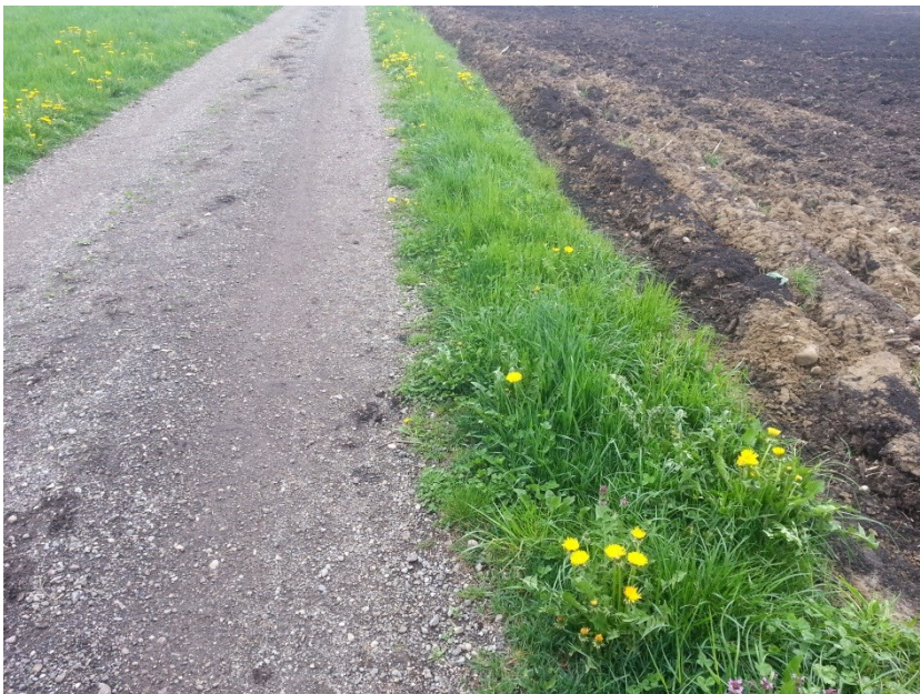
Bild 3: Empfehlung Pflügabstand bei Naturstrassen mind. 0.5 Meter