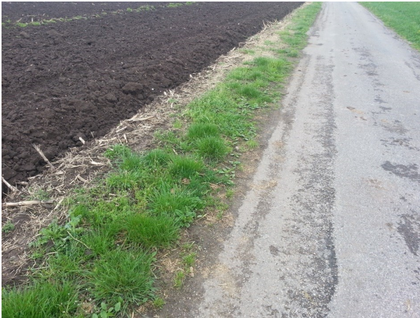
Bild 2: Empfehlung Pflügabstand bei Belagstrassen mind. 1.5 Meter