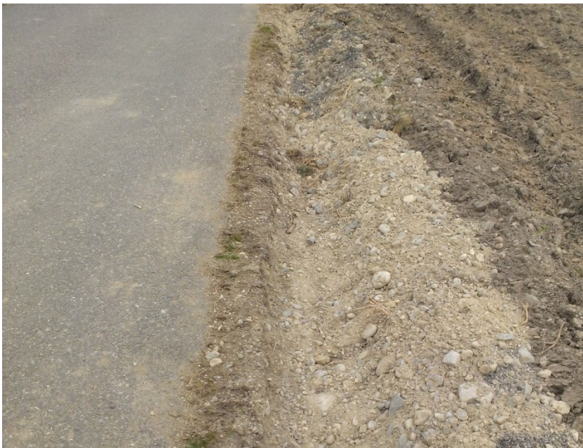
Bild 1: Schadensbild durch umgepflühtes Bankett mit sichtbarem Fundationsmaterial

Vorlage ist das Muster- Reglement für Güterstrassengenossenschaften des Bau-, Umwelt- und Wirtschaftsdepartementes gemäss der Kantonalen Landwirtschaftsgesetzgebung. Nach der Ausarbeitung des Strassenreglements durch die jeweiligen Genossenschaften erfolgt die Genehmigung durch die Generalversammlung sowie durch die Dienststelle Landwirtschaft und Wald.